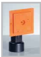
Installationskit mit quadratischen Einbaudosen (Artikel-Nr. 1450.4B)

Das Kit für den Anlagenbau enthält nur das für die Installation notwendige Material. Die Saugsteckdosen gelten als Vervollständigung der Anlage und müssen separat im Katalog ausgewählt werden.